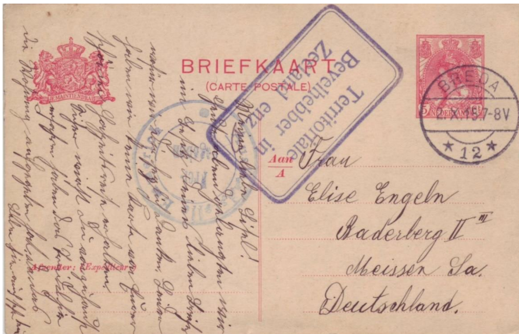
Oktober 1915, briefkaart van Breda naar Duitsland, met censuurstempel van de Territoriale bevelhebber in Zeeland én van de Duitse censuur in Emmerich.